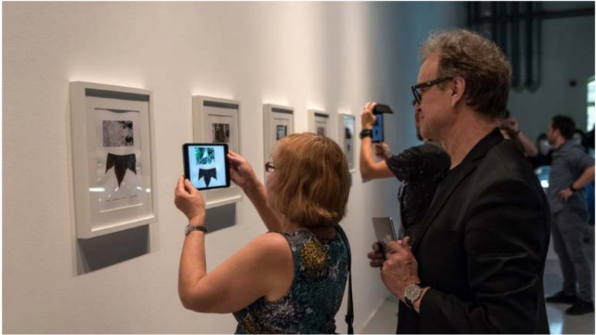
Capture in Half (2016)

藤幡正樹目前正與香港浸會大學電影學院和歷史系聯合創作一個虛擬現實藝術項目。本次展覽將有幸展出其中一段創作過程的短片。ZOTAC Technology Limited 慷慨借出多部高配置的電腦支持此項目。